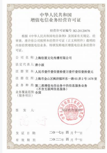
国家增值电信业务经营许可证