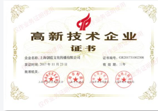
上海市高新技术企业证书