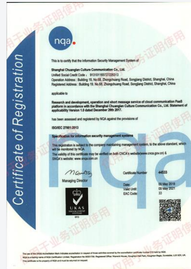
国际通讯业企业认证