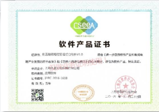
上海市软件产品证书