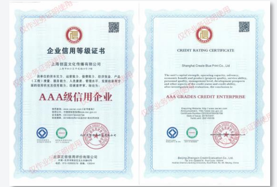
国家AAA级信用企业证书