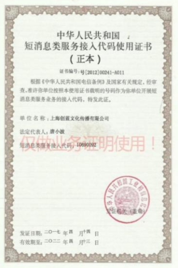
国家短信服务接入代码使用证