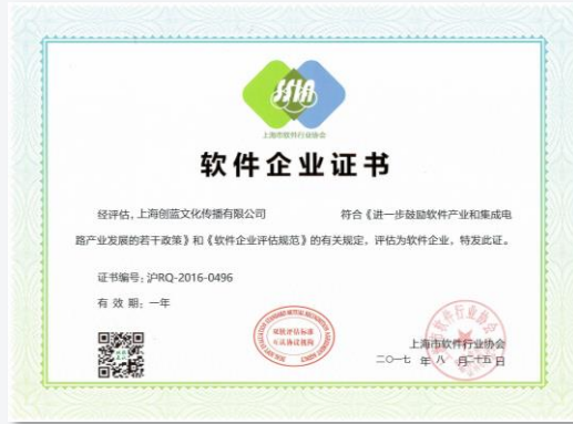
上海市软件企业证书