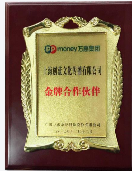
万惠集团金牌合作伙伴